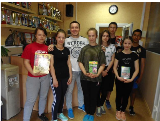
«Быть здоровым – это стильно!» - беседа и практические занятия в фитнес-клубе «Стимул» ГАУКС «Возрождение»