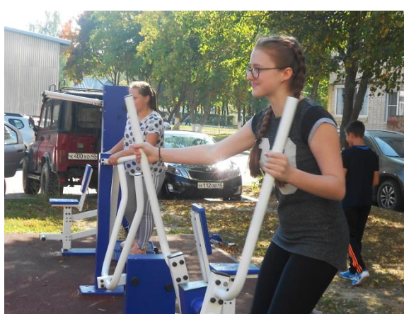
«Мы любим спорт!» - занятия с подростками на тренажёрной площадке города мкр. Протва г. Жуков